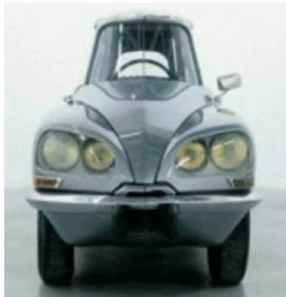
La DS, 1993 Citroën DS modifiée 140.1 x 482.5 x 115.1 cm Collection Fonds national d'art contemporain

Site internet : http://www.ds-club-armorique.com/